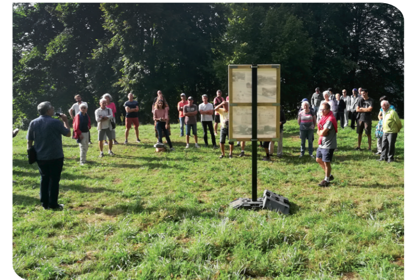
Schéma directeur de mobilités actives

Initié à l'automne 2021, une commission mobilité a été mise en place, rassemblant des élus, des habitants membres d'associations locales et le cabinet Infraroute, nous accompagnant sur cette étude d'aménagement. Plusieurs réunions en salle et sur le terrain ont permis de définir les possibilités d'amélioration, de sécurisation de tronçons pour les piétons et les cyclistes, et les modes doux en général.